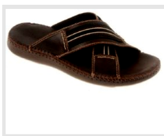
Young Spirit Sandály Hlášení RAPEX 39/2012

Pánské sandály hnědé barvy s hnědými semišovými stélkami. Svršek je z hnědé kůže s tmavě hnědou syntetickou podšívkou. Velikost 46.